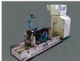
ダイナミックバランスサー